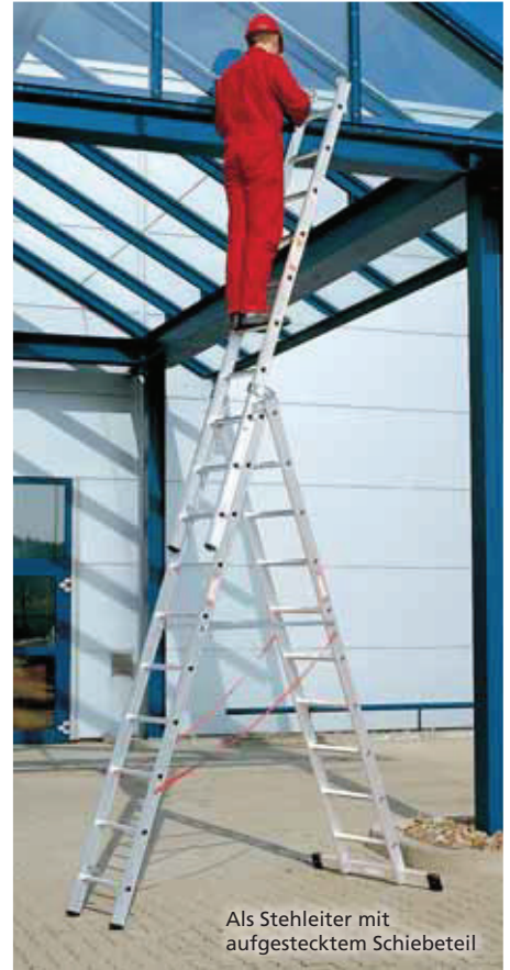
Als Stehleiter mit aufgestecktem Schiebeteil