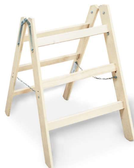
Anwendungsbeispiel mit Steg Typ 840