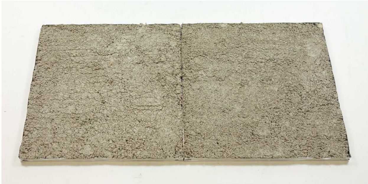
A016: MultiMörtel MULTI 61