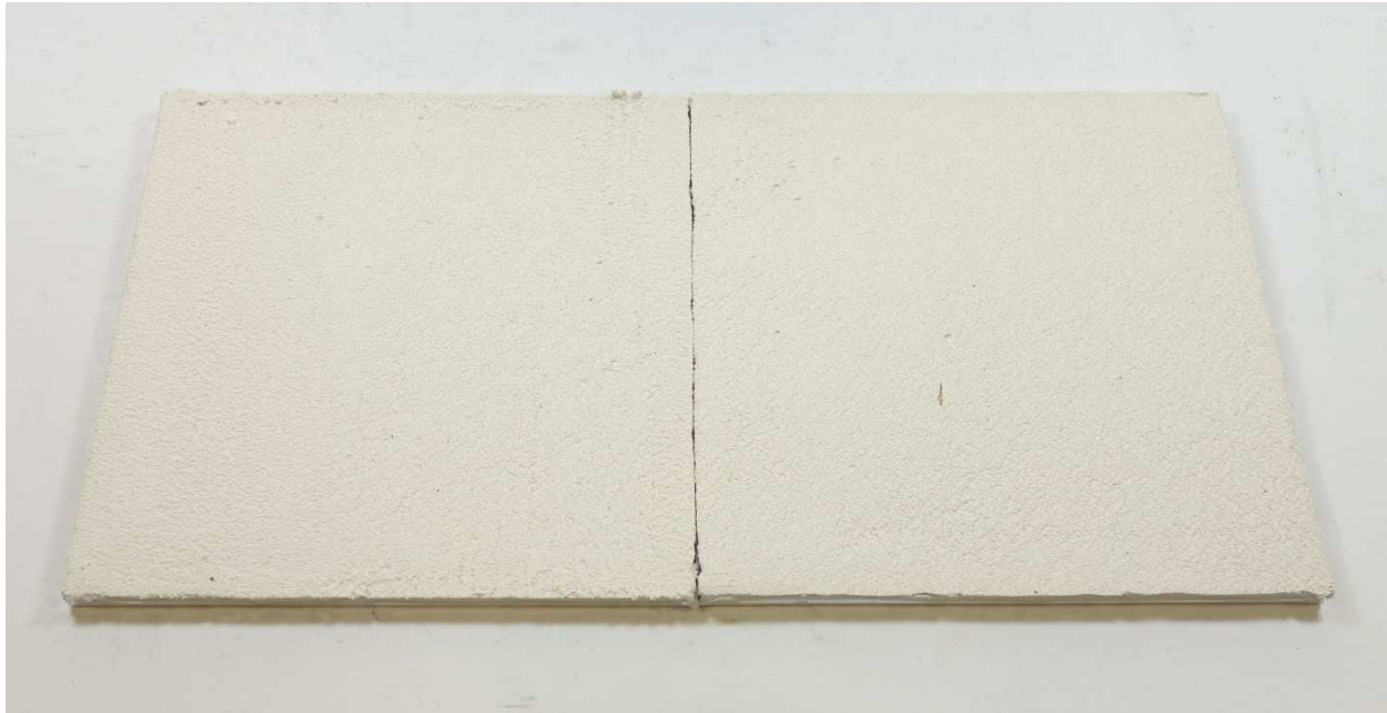
A007: multiContact MC 55 W