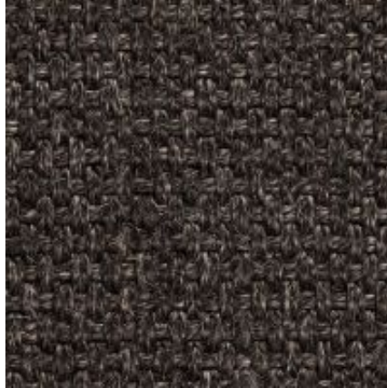
Quito - anthrazit | 044