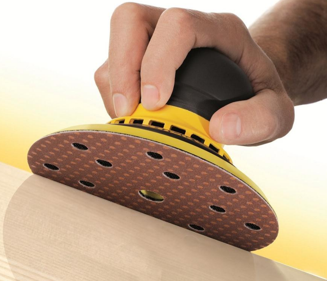
Selective Coating™ Technology