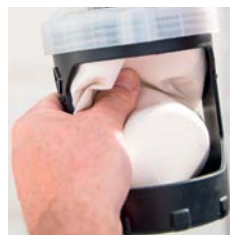
2. Verbleibende Luft herausdrücken