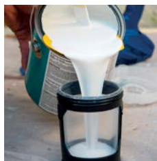
1. FlexLiner™ Sack mit Material befüllen