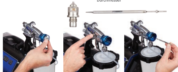
1. Entfernen Sie die Luftkappe und die Düse.