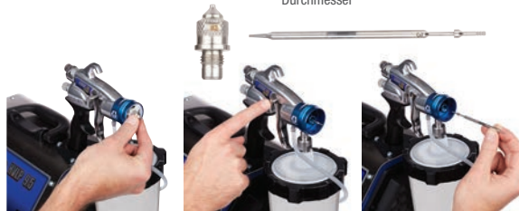
1. Entfernen Sie die Luftkappe und die Düse.