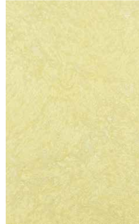
Claudius | L12 + ADDITIVO GOLD