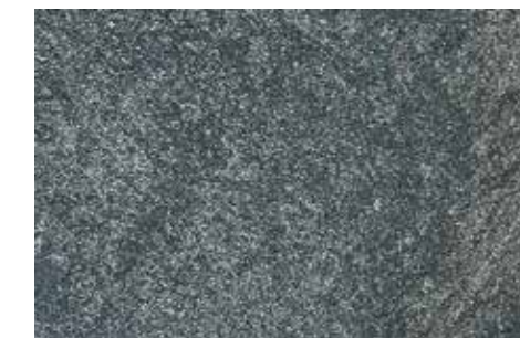
Titus | H13 + ADDITIVO SILBER