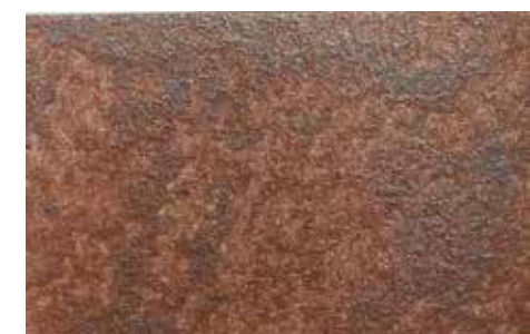
Maximus | H16 + ADDITIVO GOLD