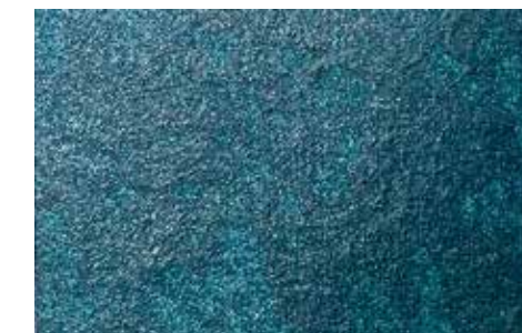
Caligula | H15 + ADDITIVO SILBER