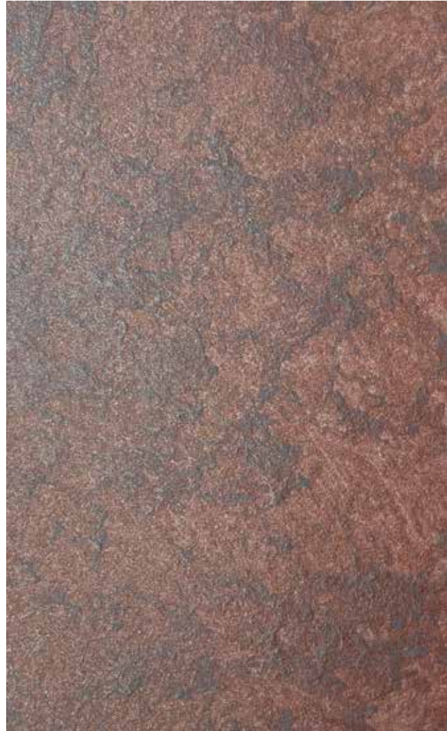
EFFETTO: Classico Maximus | H16 + ADDITIVO GOLD