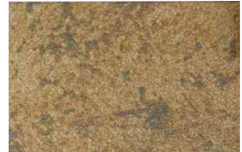
Romulus | H12 + ADDITIVO GOLD