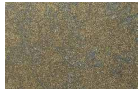
Remus | H14 + ADDITIVO GOLD