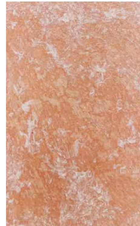
Caesar | L14 + ADDITIVO GOLD