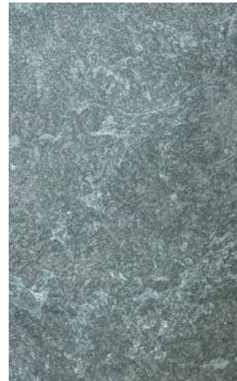
Nero | L13 + ADDITIVO SILBER