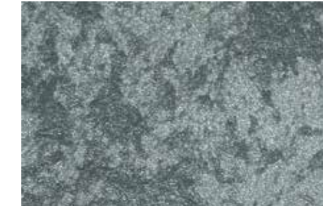
Nerva | H11 + ADDITIVO SILBER

Hier trifft sie zusammen – die Einfachheit des rostigen Eisens und der leuchtende Glanz von Pigment und Edelmetall. ARTISTIC COLOR EFFETTO METALLO eignet sich gleichermaßen für exklusive und moderne wie auch für stilvolle Wand- und Deckengestaltungen. Auch die Kombination von gold und silber lässt moderne und raffinierte Oberflächen entstehen.