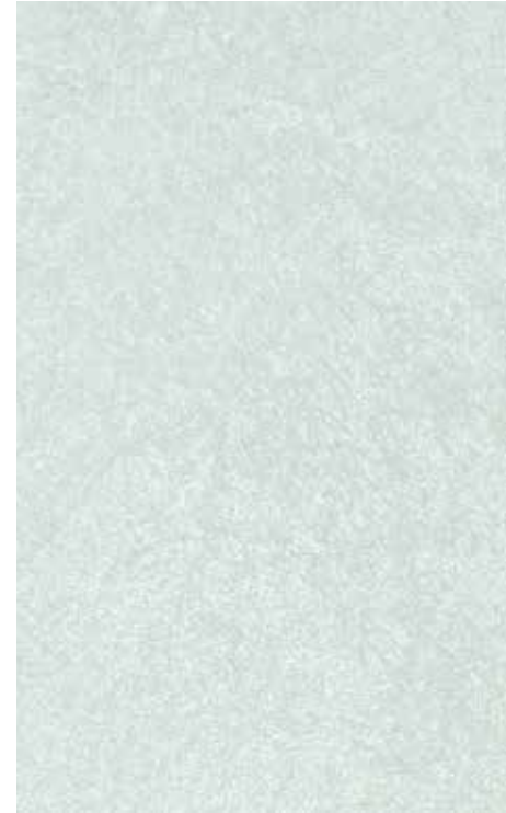
Augustus | L11 + ADDITIVO SILBER