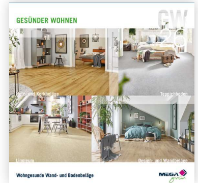
Wohngesunde Wand- und Bodenbeläge Wohngesunde Wand- und Bodenbeläge

Alle Qualitätsprodukte dieser Kollektion sind CE zertifiziert.