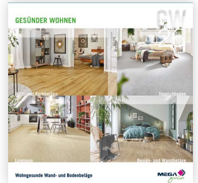
Wohngesunde Wand- und Bodenbeläge