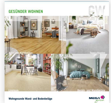
Wohngesunde Wand- und Bodenbeläge

Alle Qualitätsprodukte dieser Kollektion sind CE zertifiziert.