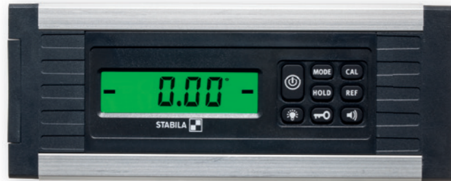
Digital-Anzeige mit zuschaltbarer Beleuchtung