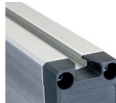
T-Nut zur flexiblen Befestigung