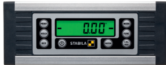
Digital-Anzeige mit zuschaltbarer Beleuchtung