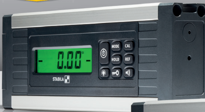
TECH 500 DP