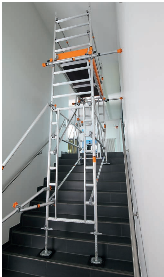
Uni Leicht mit Treppen-Kit Lösung