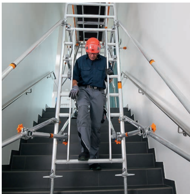
Uni Leicht mit Treppen-Kit – baustellentaugliche Durchgangswege

Das Treppen-Kit für das Uni Leicht ermöglicht den sicheren und flexiblen Einsatz von Fahrgerüstteilen in Treppenhäusern: Es bedarf keiner Umbauarbeiten, da die Treppe trotz Gerüst weiter begehbar bleibt. Durch die Erweiterung der standardmäßigen Gerüsttypen mit wenigen Einzelbauteilen bietet das Treppen-Kit in Kombination mit dem Uni Leicht eine wirtschaftlich clevere, schnelle und sichere Lösung für das Arbeiten in der Höhe – auch als Alternative zu Sprossenleitern, welche aufgrund der aktuellen Vorschriften zur Arbeitssicherheit nur noch bedingt einsetzbar sind. Nach der Montage der Basis auf den Treppenstufen kann der Aufbau der benötigten Gerüstebenen mit dem bereits bewährten Sicherheitsaufbau P2 ausgeführt werden.