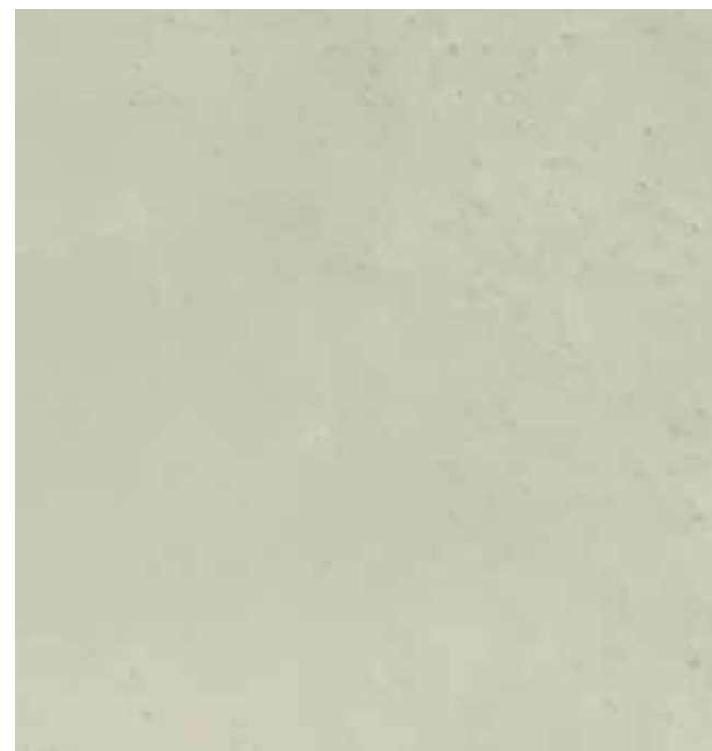
Serpentina | B12