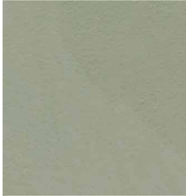
Verde | B11