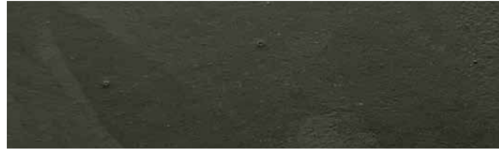
Onyx | B13