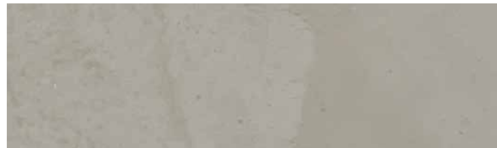
Ferro | B15