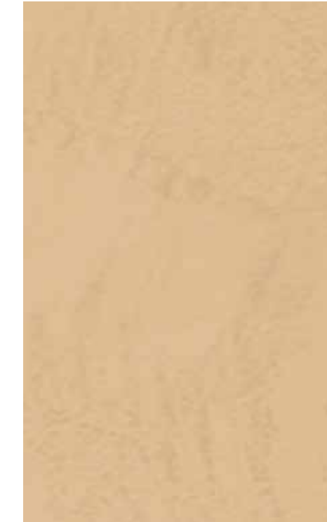
Marrone | B17