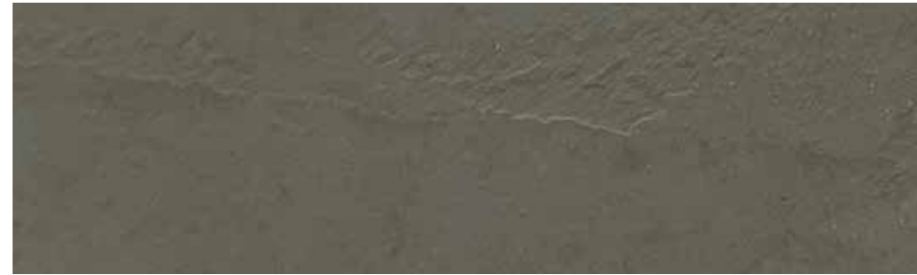
Grafite | B14