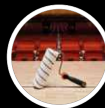
Auf Holzböden aller Art einsetzbar