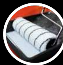
Bestens geeignet für lösemittelbeständige, zähflüssige Materialien