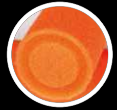
Spezialrillen für perfektes Streichbild