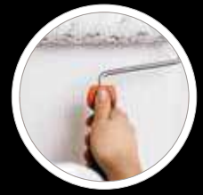
Daumenablage sorgt für optimiertes Andrückverhalten der Walze