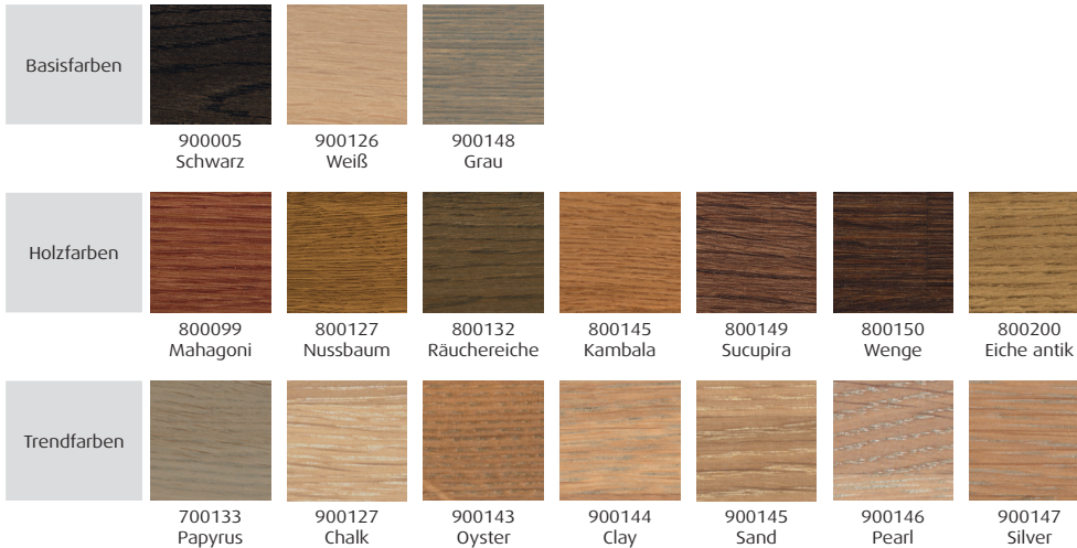
Abbildung nicht farbeverbindlich