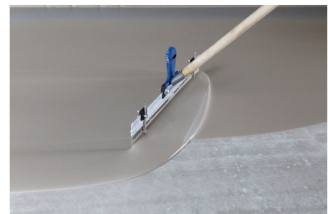
PCI FT Plan überzeugt mit einem sehr guten Verlauf und einer glatten Oberfläche