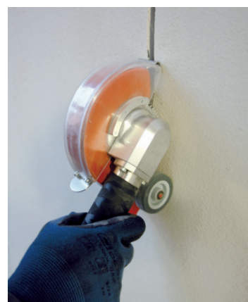
Für Kabelschlitze in Beton, Klinker usw.