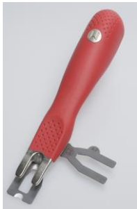
Zum Abstoßen der Schweißschnur empfehlen wir das Mozart Abstoßmesser