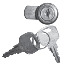
Zylinderschloss mit 2 Schlüssel Cylinder lock with 2 keys