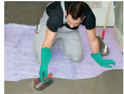
Die geeignete PCI Bodenausgleichsmasse wird auf der ausgelegten Glasfaserverstärkung PCI Armiermatte GFM ausgegossen und mit einer Spachtel verteilt (Mindestschichtdicke 5 mm).