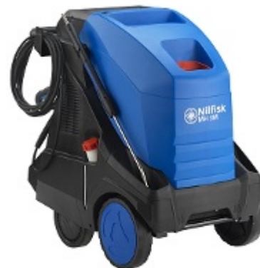
Abb. MH 3M ohne Schlauchtrommel