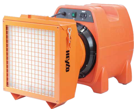
Auch als Staub-/Farbstop 3000 inkl. Filter